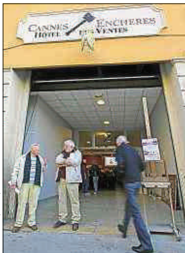
Samedi, devant la salle d'enchères.

Des certificats que la France ne délivre plus depuis janvier. Selon l'entreprise, rien n'empêche les acheteurs de pro-