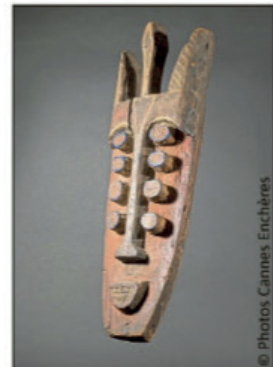
Visage Calabar anthropo-zoomorphe schématisé du Nigeria - Début du XX e siècle - En bois sculpté et pigments - H : 74 cm. Adjudgé : 10 000 €.