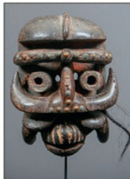
Masque de danse Bété de Côte d'Ivoire - Début du XX e siècle - En bois, clous en cuivre et pigments naturels avec ancienne patine d'usage brune - H : 30 cm - Adjudgé : 10 000 €.