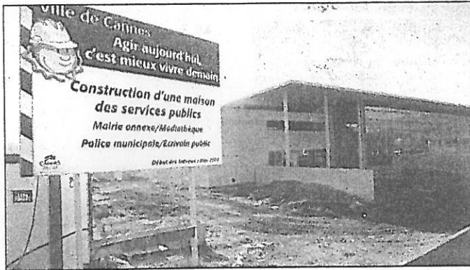
Le bâtiment de la future Maison des services publics abritera une médiathèque, un poste de police et une mairie annexe.