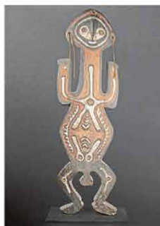
Grande figure Bioma en bois sculpté et pigments – Papouasie Nouvelle Guinée, première moitié du XX e siècle – H : 119 cm. Estimation : 20 000 €/ 25 000 €.

peinture rituelles. Ce type de figure rituelle d'ancêtre servait d'intercesseurs lors de cérémonies entre les hommes et leurs ancêtres